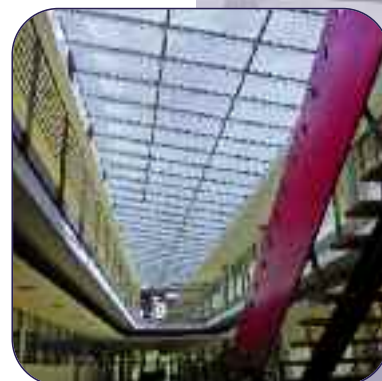
Wärme- und Blendschutz