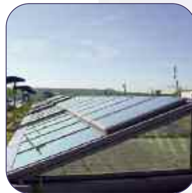
Wärme- und Blendschutz