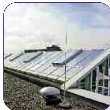
Wärme- und Blendschutz