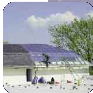
Wärme- und Blendschutz