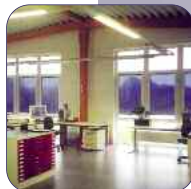
Lichtreflex für Bürogebäude