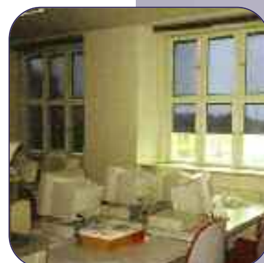
Lichtreflex für Bildschirmarbeitsplätze